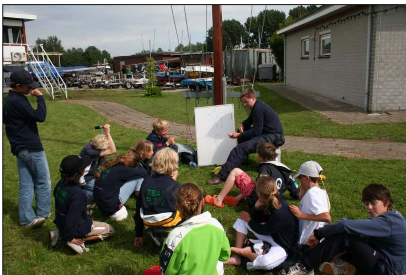
Nabespreking bij Aegir