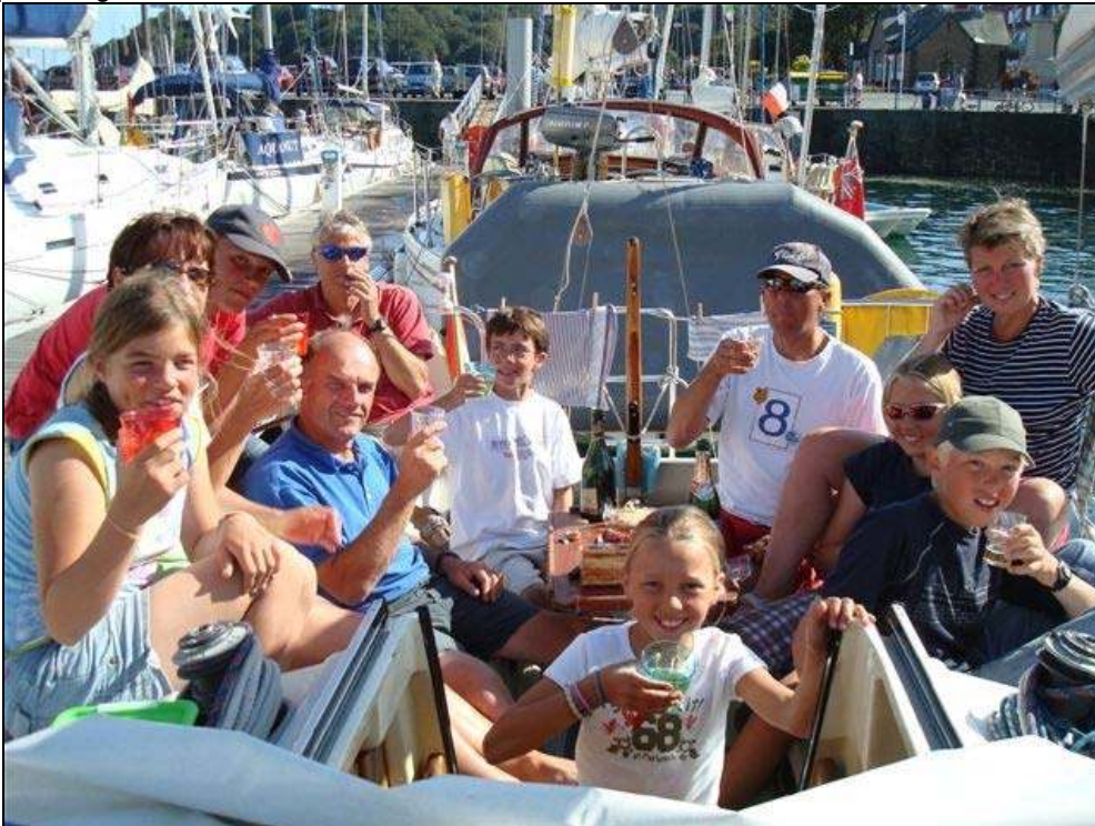
Bestemming gehaald (Guernsey), dat wordt met champagne gevierd