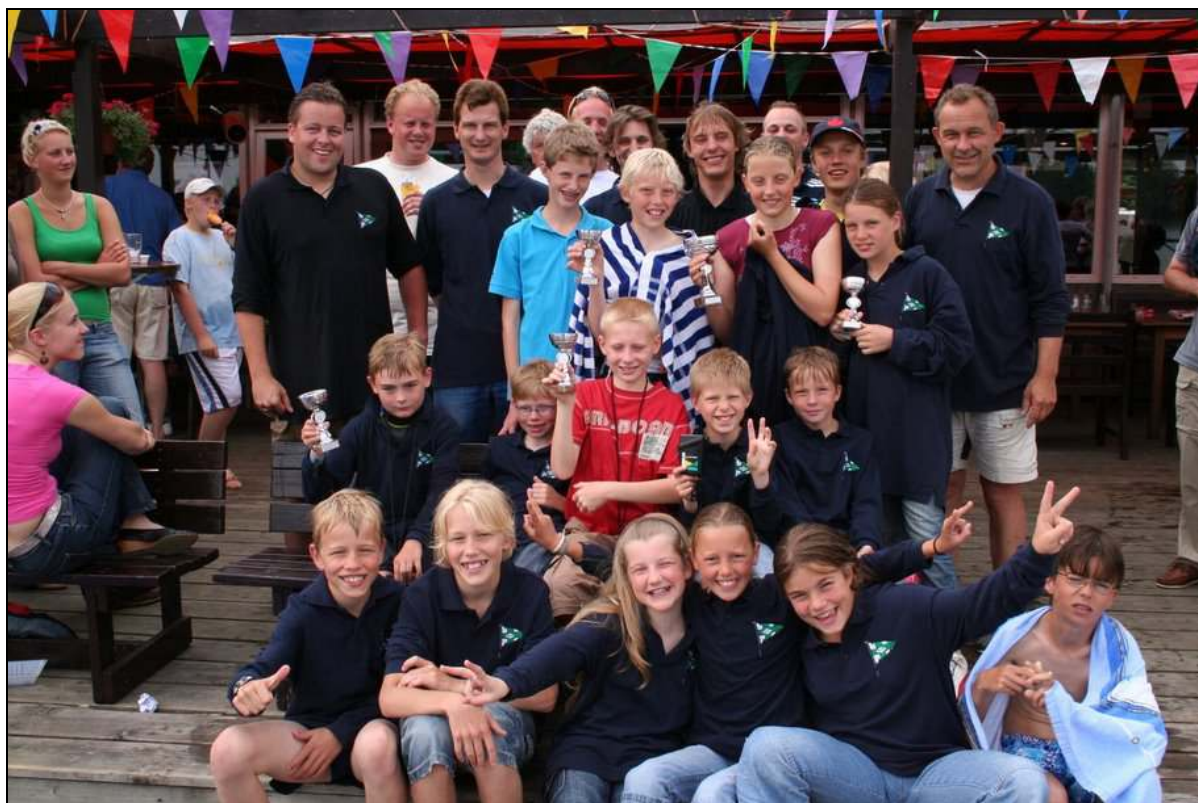
Na de prijsuitreiking op de Binnenmaas

Wat begon als een leuk idee, is in korte tijd uitgegroeid tot een enthousiast team van zeilende kinderen, stimulerende coaches en begeleidende ouders. Voorzien van goede kwaliteit teamshirts was iedere Combi-wedstrijd een feestje op zich. Ook de reacties van ouders en kinderen uit andere verenigingen waren zeer positief: gedurende de Combi-periode sloten zich nog een aantal zeilers bij Team R.Z.V. aan. Kijk voor de totale uitslag van de Combi wedstrijden op www.teamrzv.tk .