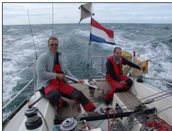
Op naar de 15.4 knopen!!

Het was een prima ervaring! Goede mensen aan boord die serieus bezig waren met het zeilen en de veiligheid van bemanning en schip maar op de goede momenten ook over de nodige humor beschikten. Een schip van zeer goede afkomst! Robuust, snel en met veel ruimte.