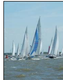
Foto voorpagina: start CAMR 2006.