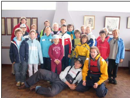
Deelnemers JZO 2006

Hopelijk hebben bovenstaande gegevens enige duidelijkheid geschept over de JZO van het komende jaar. Wij hebben er in ieder geval heel veel zin in en hopen dat dit ook voor jou geldt. Je kunt je inschrijven via het inschrijfformulier, te vinden op de website, www.rzv.nl .